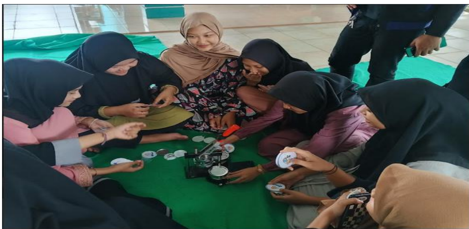
Gambar 4. Proses cetak hasil printing kedalam gantungan kunci