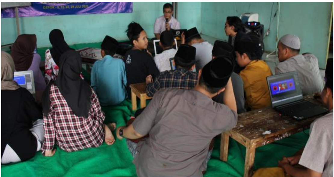
Gambar 1. Proses pengajaran untuk desain grafis

Berikut dilampirkan foto/gambar dari suasana PKM di Pesantren Nurul Muta'allimin Ratujaya Cipayung Depok :