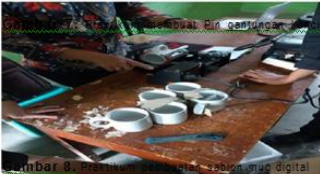
Gambar 5. Proses pembuatan sablon gelas keramik / mug