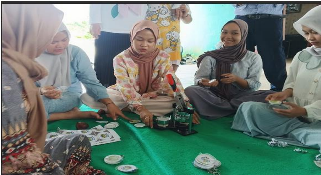
Gambar 3. Pencetakan produk setelah dilakukan digital printing