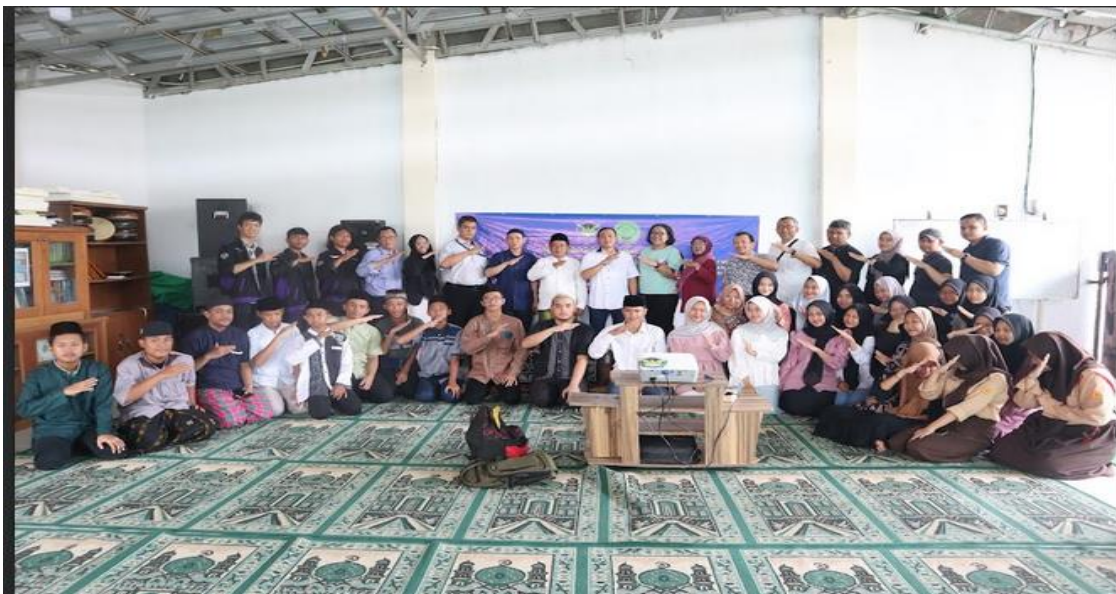
Gambar 6. Foto bersama ketua RW, pimpinan pondok pesantren, dosen tetap simi mahasiswa unsurya dan para santri-santri